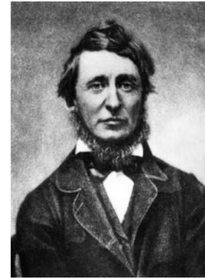
Henry David Thoreau (Concord, EE.UU. 1817-1862)

Hay quien no camina nada; otros, lo hacen por carretera; unos pocos, atraviesan fincas. Las carreteras se han hecho para los caballos y los hombres de negocios. Yo viajo por ellas relativamente poco, porque no tengo prisa en llegar a ninguna venta, tienda, cuadra de alquiler o almacén al que lleven. Soy buen caballo de viaje, pero no por carretera. El paisajista, para indicar una carretera, usa figuras humanas. La mía no podría utilizarla. Yo me adentro en la Naturaleza, como lo hicieron los profetas y los poetas antiguos, Manu, Moisés, Homero, Chaucer. Podéis llamar a esto América, pero no es América; no la descubrió Américo Vespucio, ni Colón, ni ninguno de los otros. Hay más verdad sobre lo que yo he visto en la mitología que en ninguna de las denominadas historias de América.....